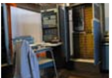
IBM 7040 (1963)