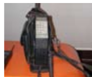
Téléphone portable Radiocom 2000 (1986)